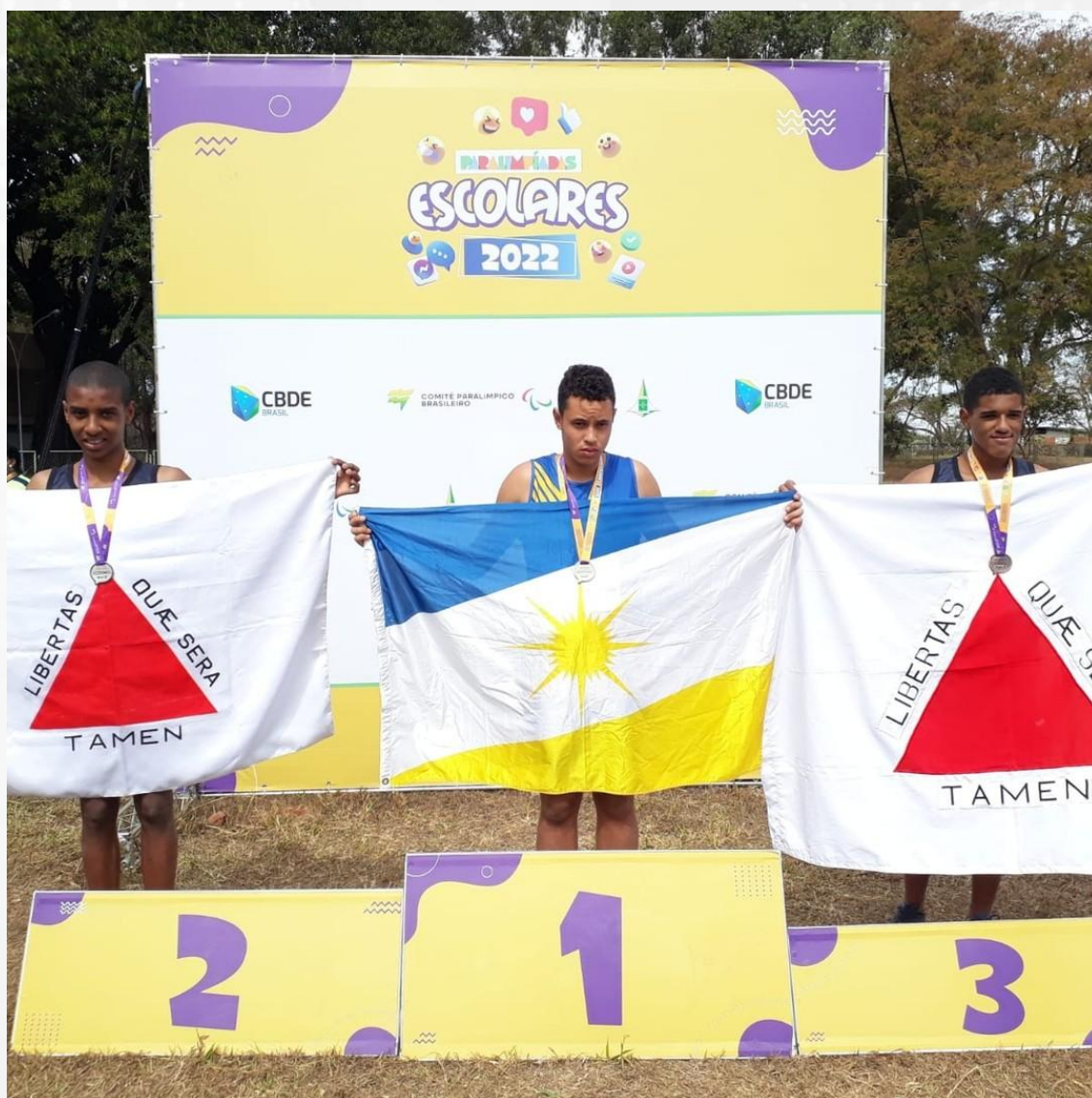
Jogos da Juventude 2022

A equipe de futebol, da Secretaria Municipal de Esportes, categoria Sub-15, classificou para a semifinal dos Jogos da Juventude 2022 – JOJU. A etapa será realizada em Guaxupé, em setembro.